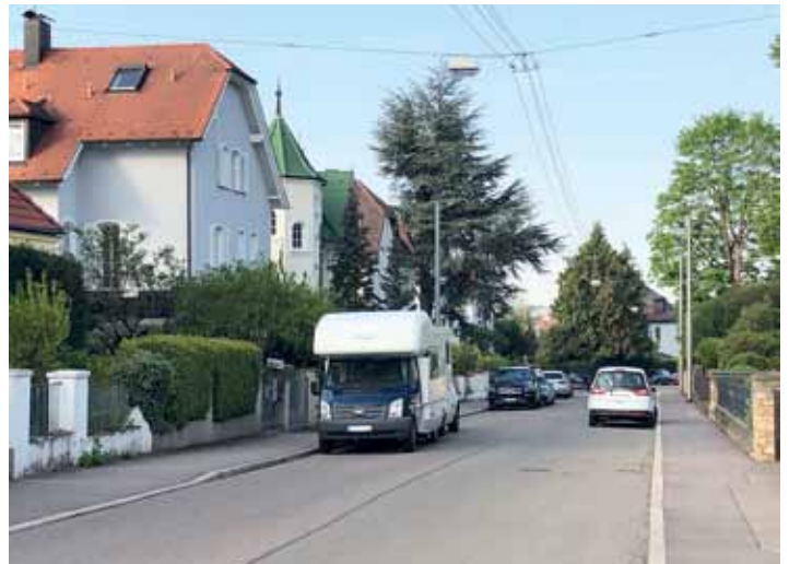
Auch der neue Daimler-Chef Ola Källenius wohnt auf der Waldau.