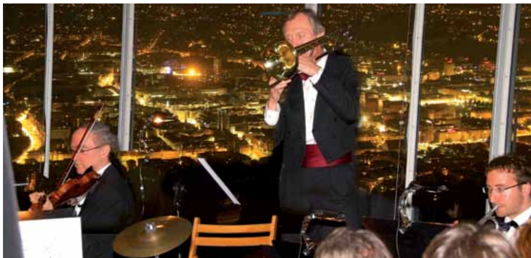
Panoramakonzert auf dem Stuttgarter Fernsehturm mit atemberaubendem Ausblick.