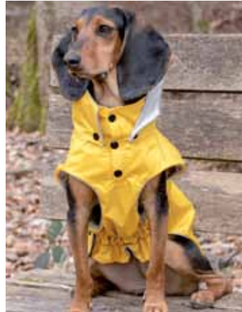
Schicke Mode für Hunde.