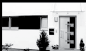
Fenster + Türen