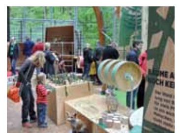
Haus des Waldes.